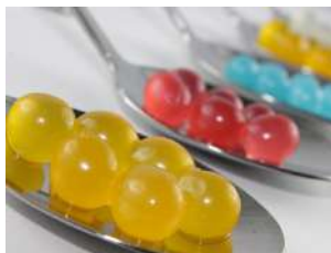
LA CUISINE MOLÉCULAIRE