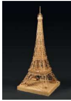
LES MAQUETTES EN ALLUMETTES