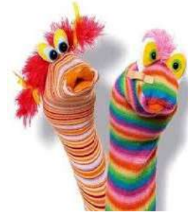
LES MARIONNETTES EN CHAUSSETTES