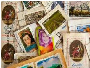
COLLECTIONNER LES TIMBRES