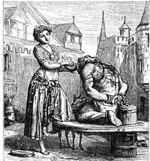
Esmeralda donnant à boire à Quasimodo sur le pilori. Gravure de Gustave Brion pour le roman (édition Hugues, 1877).